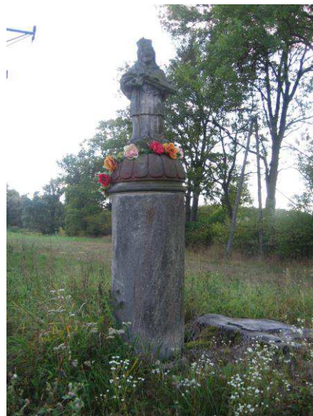
Figura św. Jana Nepomucena w Jankowicach