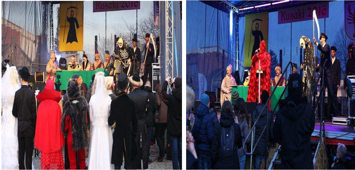
Zdj. Widowisko obrzędu „Ścięcie śmierci” w Jedlińsku.

utożsamia się czasami ze zjawiskiem niszczenia (ścinania, topienia bądź palenia kukieł uosabiających zimę).