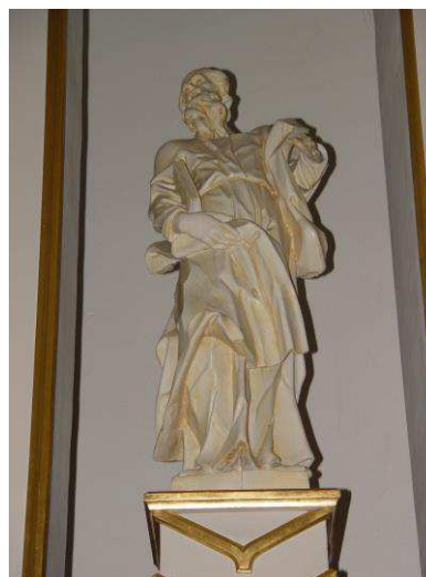
Rzeźba św. Piotra