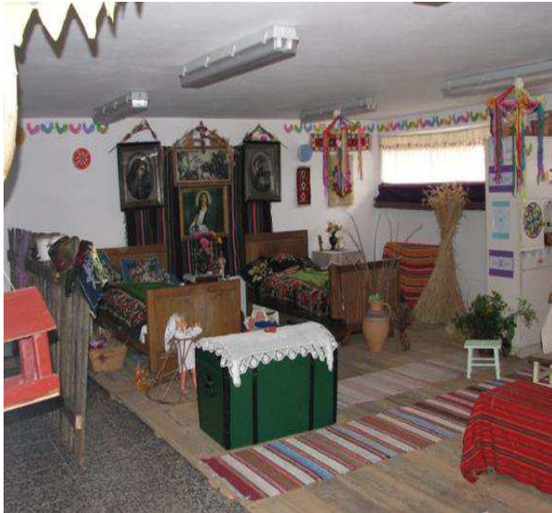
Izba regionalna we Wsoli