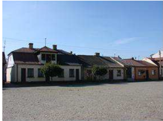
Pierzeje przyrynkowe w Jedlińsku