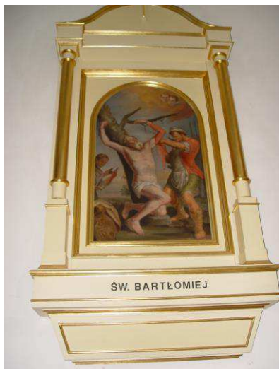
Obraz św. Bartłomieja