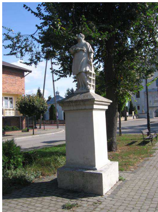
Figura św. Wawrzyńca w Jedlińsku