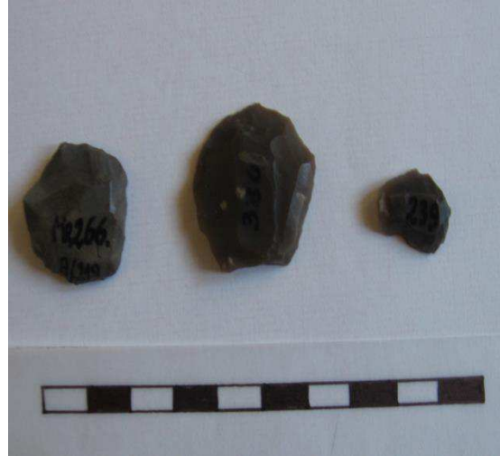
Krzemienne artefakty z terenu gm. Jedlińsk (udostępnienie Muzeum im. J. Malczewskiego w Radomiu)

Niezwykle interesująco reprezentowany jest okres halsztacki związany z wczesną epoką żelaza ( Jankowice stan.2,4,5,6, Jankowice-Kolonia stan.1, Ludwików stan.3, Piastów-Gózddek stan.1,3,5,7) , a także z okresem rzymskim( Gutów-Bród stan.1, Jankowice stan.4, Ludwików stan.1,2). Okres średniowieczny związany jest głównie ze stanowiskami (Jankowice stan.1-dwór obronny na kopcu, Jankowice stan.4,5, Jankowice-Kolonia stan.2, Klwaty stan.2, Piaseczno stan.1, Płasków stan.1). Do znalezisk pochodzących z okresu nowożytnego, należą przede wszystkim stanowiska (Boża Wola stan.1, Jankowice stan.2, Jankowice 4,5,6, Jedlińsk stan.2, Klwaty stan.4, Wierzchowiny stan.1). Z literatury przedmiotu znane jest także sepulkralne stanowisko archeologiczne z miejscowości Wola Bierwiecka pochodzące z okresu wczesnego średniowiecza. Stanowisko to zostało odkryte w okresie międzywojennym i związane jest z dość ciekawymi artefaktami pozyskanymi w czasie nieregularnych badań prowadzonych z upoważnienia Państwowego Muzeum Archeologicznego w Warszawie. Na terenie gminy Jedlińsk odnotować należy istnienie obiektu o tzw. własnej formie krajobrazowej: