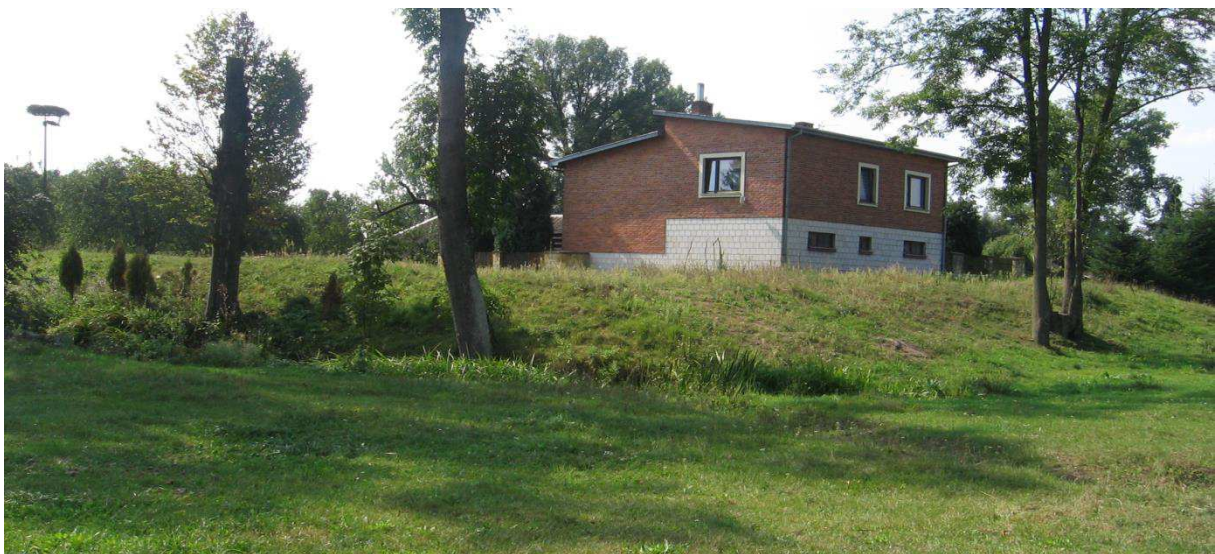
Jankowice. Relikty ziemnego założenia obronnego tzw. dworu na kopcu w tle współczesna zabudowa siedliskowa.

sondażowych badań archeologicznych prowadzonych w latach 70 przez Pracownię Konserwacji Zabytków (PP PKZ) oddział w Łodzi, stwierdzono istnienie na omawianym terenie istnienia dworu obronnego wzniesionego w okresie późno średniowiecznym lub na początku okresu nowożytnego, przebudowywanego w wiekach późniejszych. W wieku XVIII stanowił część folwarku z założeniem parkowym.