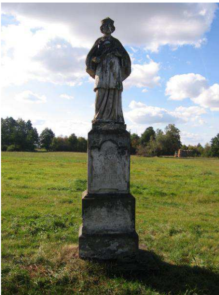
Figura św. Jana Nepomucena w Brodzie