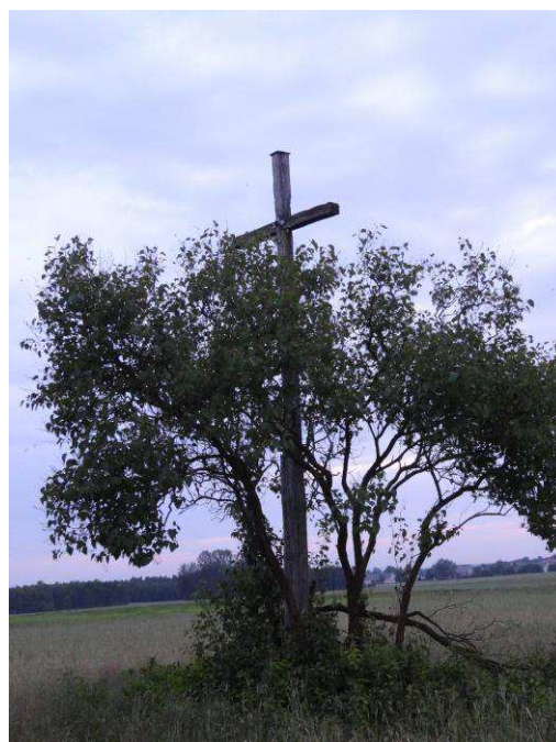
Drewniany krzyż w Bierwcah