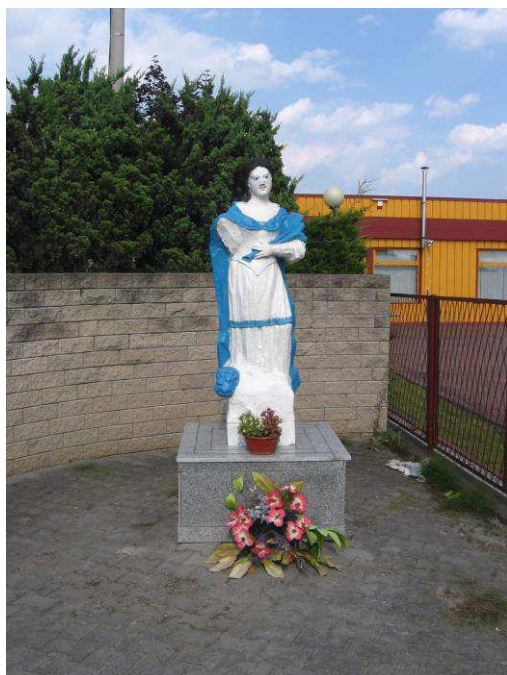
Figura św. Tekli w Wielogórze