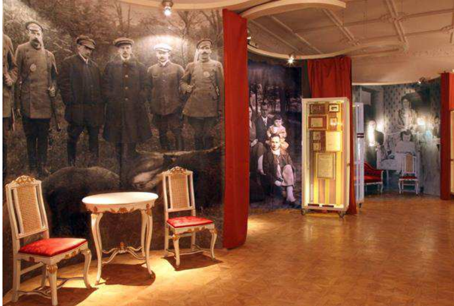
Fragment ekspozycji Muzeum im. W. Gombrowicza we Wsoli

elementy umeblowania. Oprócz tego na ekspozycji zaprezentowano zbiór różnorodnej dokumentacji w tym autorskie listy, rękopisy i fotografie.