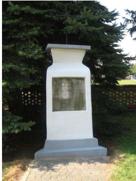
Nagrobek na cmentarzu przykościelnym