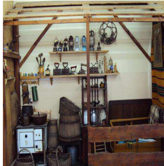
Izba regionalna w Bierwcach