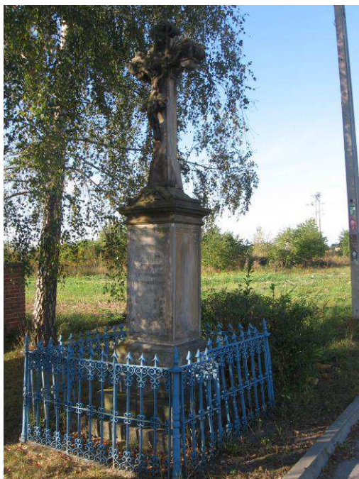
Krzyż przydrożny fundacji Salewskich w Jedlińsku