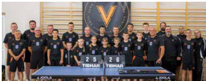
● UKS Viktoria Jedlińsk przed sezonem 2025/2026.