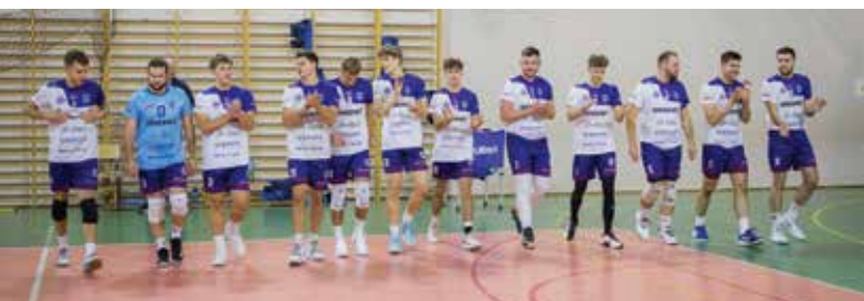
● Drużyna siatkarzy przed meczem z UKS Orłęta Raszyn