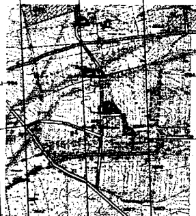
WYRYS ZE STANIEM LWARUNKOWAN I KIERUNKOW ZAGOSPODAROWANIA PRZESTRZENNEGO GMINY JEDLIŃSK

NINIEJSZY RYSUNEK PLANU STANOWI ZAŁĄCZNIK NR 1 DO UCHWAŁY NR III/2/2011 RADY GMINY JEDLIŃSK Z DNIA 25.02.2011